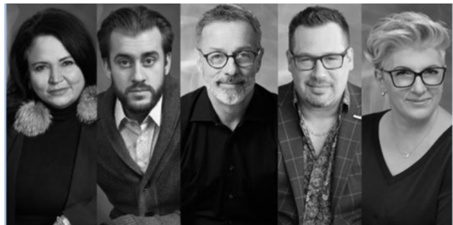
Dragons 6e édition