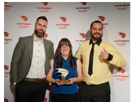
Les grands gagnants Ferme Ragnarüches