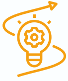
Table de concertation jeunesse de Sept-Îles

Le CJED est porteur de la TCJSI. Par cette table de concertation, notre mandat est d'animer les partenaires du milieu et les mobiliser autour des enjeux liés aux jeunes. Nous avons plus d'une trentaine d'organisations du milieu qui siègent à cette table dont leur mandat touche les enjeux jeunesse.